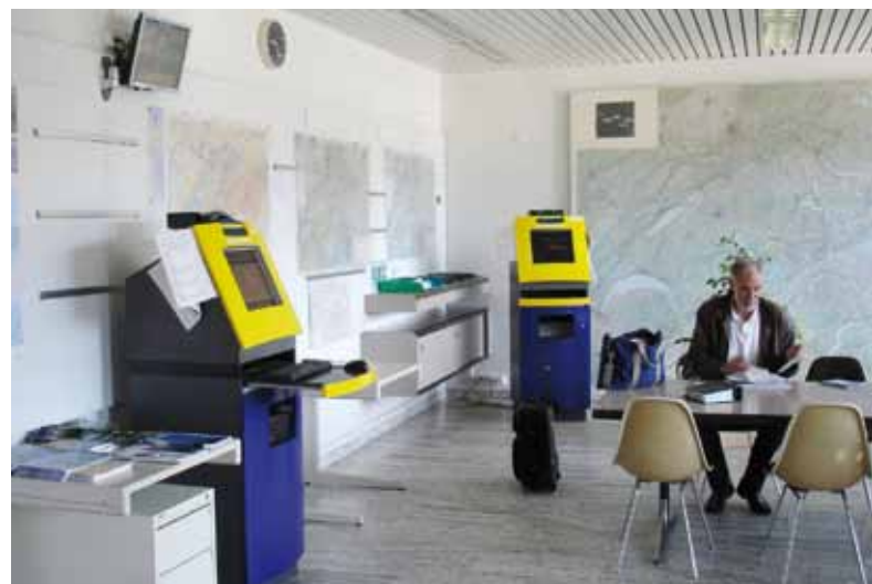
Gerade bei Flügen im Ausland ist eine gründliche Flugvorbereitung erforderlich. Blick in eine Self-Briefing-Station am Flugplatz Locarno, Schweiz.

Wer nicht lange nach der Internetseite von AIS-Stellen im Ausland suchen möchte, kann die Seite von EUROCONTROL nutzen. Unter http://www.eurocontrol.int/articles/ais-online werden alle europäischen AIS-Internetseiten geführt. Wetterinformationen findet man bei http://euro.wx.pilots.net/ .